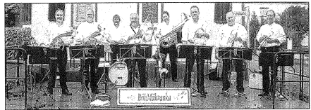
Die Freude und der Spaß an der Musik stehen bei BöhMähranka an vorderster Stelle.

ponate und Informationen über die Sorgen und Nöte vergangener Generationen in dieser schönen Stadt werden zu erfahren sein. Außerdem wird den Teilnehmern näher gebracht, wie facettenreich die Geschichte Bad Cambergs in den letzten Jahrhunderten war. Am Freitag, 12. September, findet wieder eine Museumsnacht statt.